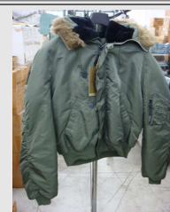
Jacket N2-B Vintage H.P.S.